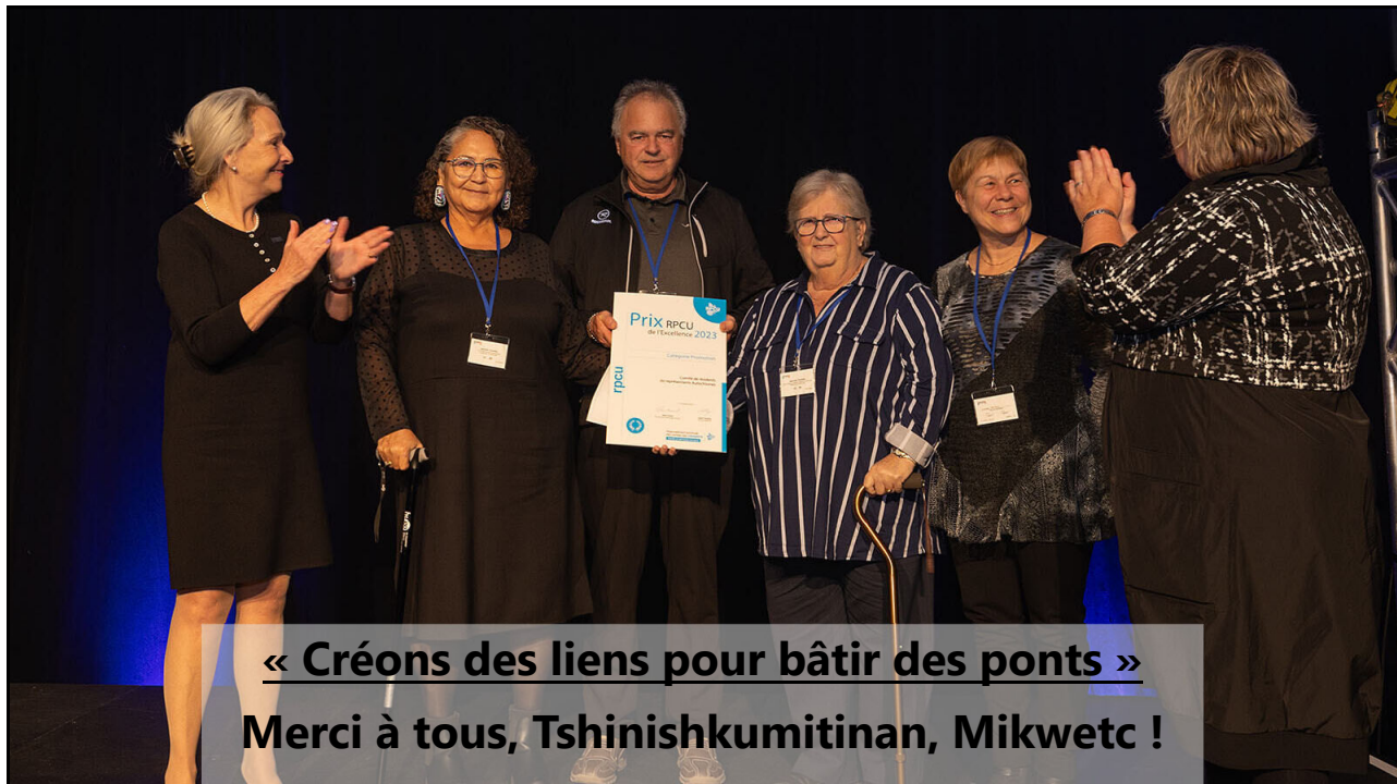
« Créons des liens pour bâtir des ponts » Merci à tous, Tshinshkumitinan, Mikwetc !