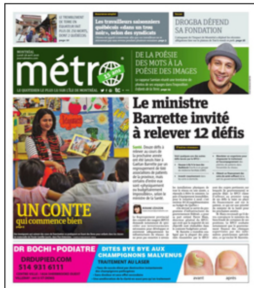
Couverture du Journal Métro du lundi 18 avril 2016